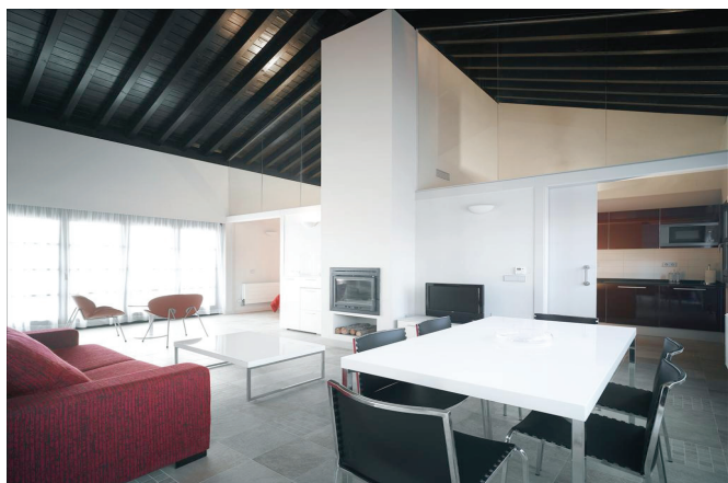
Stora rymliga villor fullt utrustade med moderna kök