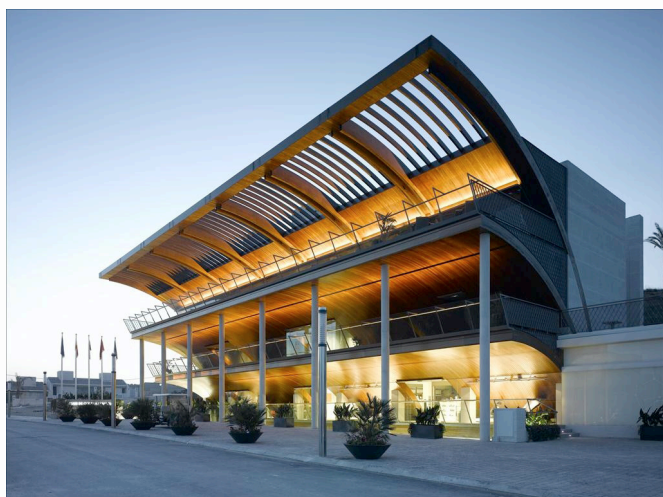
Klubbhus & restaurang

Vi har hittat en golfanläggning intill Alicante's kustlinje som passar alla typer av spelare. Banan är designad av legenden Seve Ballesteros och utmanar även den bättre spelaren med sina svårbemästrade greenområden. Banan är förhållandevis ganska kort och passar därför även den mindre erfarna golfspelaren, banan är i sin helhet medelsvår. Vissa hål karaktäriseras av vatten som slingrar sig runt greenområden och fairways med de flesta hål har öppna ytor att lita på.